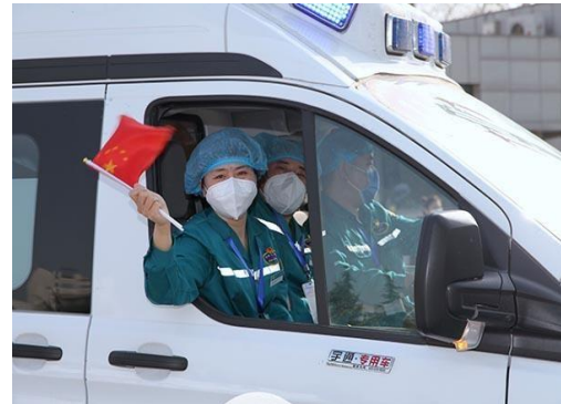
Les médecins de la YRCC reviennent de la ville de Wuhan

fleuve Jaune dans l'histoire, des stratégies et méthodes similaires ont été utilisées.