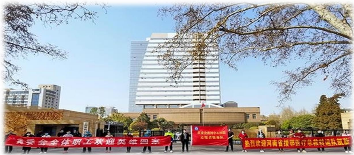
Traduction des banderoles :

Nous espérons donc que l'expérience chinoise aidera les autres pays actuellement atteints, à mieux affronter la pandémie.