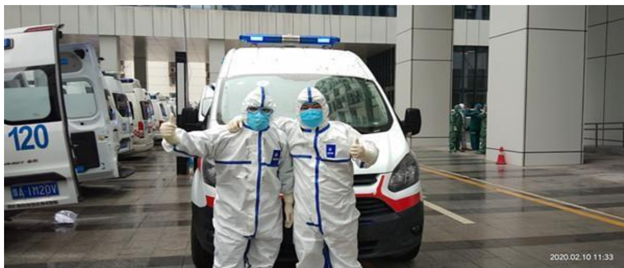
Renfort des équipes médicales de la Commission de Conservation du Fleuve Jaune à Wuhan

quotidienne et à établir un dossier de santé pour leur permettre de retracer leur parcours, évaluer leur état de santé, et leur apporter un soutien moral. A la fin de la période de confinement, la YRCC a donné l'autorisation à un nombre restreint du personnel à retourner au bureau, et encouragé le télétravail quand le déplacement quand le déplacement au travail n'était pas nécessaire. Au début du printemps, le fleuve Jaune est généralement inondé par la fonte des glaces dans sa partie supérieure et la demande en eau est forte pour l'irrigation et l'environnement dans sa partie inférieure. Cette année, la YRCC a mis en ligne la réunion de consultation des parties prenantes sur la prévention des inondations et la répartition de la ressource en eau – suivie par un centre de contrôle à distance, qui fonctionne également très bien –. Aujourd'hui, le bureau de la YRCC a déjà repris ses activités normales, mais la lutte contre COVID-19 n'est pas terminée. Il incite la population à porter un masque facial et à éviter les rassemblements et les déplacements publics.